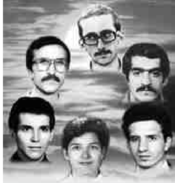
Her biri namluya sürülmüş kurşun, yayından fırlayan oktur... Komutan, eylem adamı, teorisyen, örgütçüdür... Toprağa gömülen köklerimiz, ileriye yürüyüşümüzün itici gücüdür...

Tarihimizde edindiğimiz savaşçı karakterimizi, şehitlerimiz şahsında yarattığımız değer ve normlarımızı korumak ve geliştirmek görevimiz... İşte bu yüzden onları her yönüyle tanımamız, temel niteliklerini bilmemiz ve bunları kendi şahsımızda yeniden üretmemiz